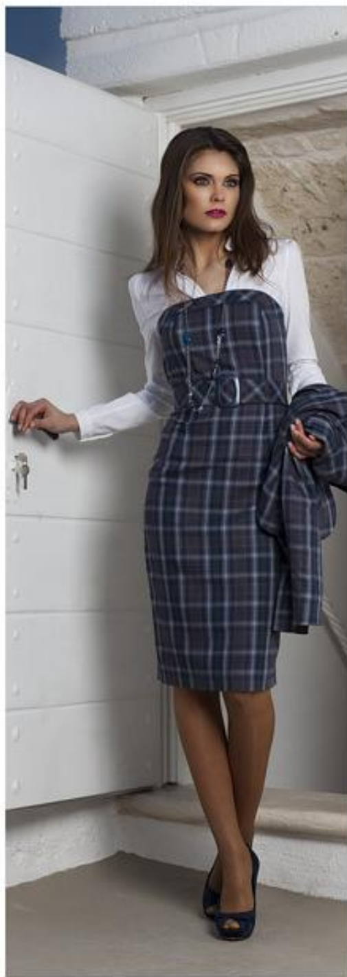
FASHION FOR BUSINESS AND AFTER